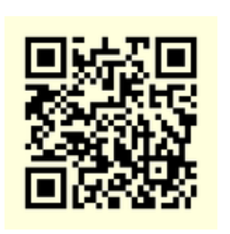
そうけいなかまリンク