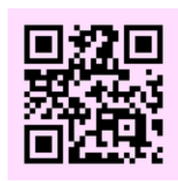
児造研ブログへのリンク