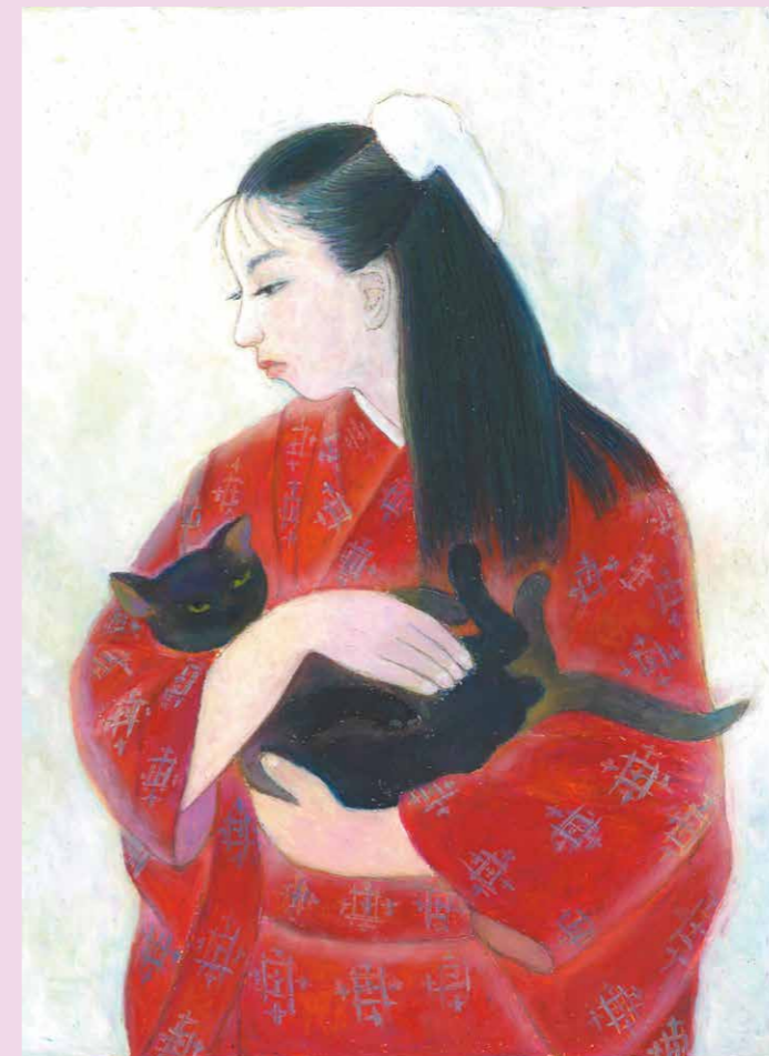
三谷 十糸子「猫と娘」模写 クレパス画。