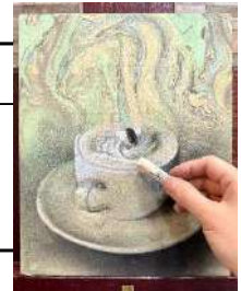
画像は、講師による制作過程です