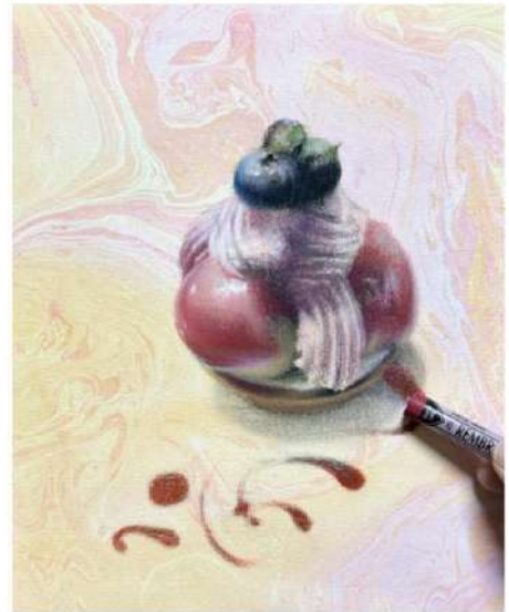
講師参考作品（制作途中）