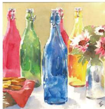
【24年3月開催】「カラフルなガラス瓶」