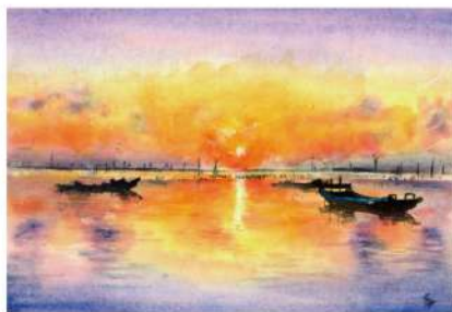
【24年2月開催】「海と夕日」